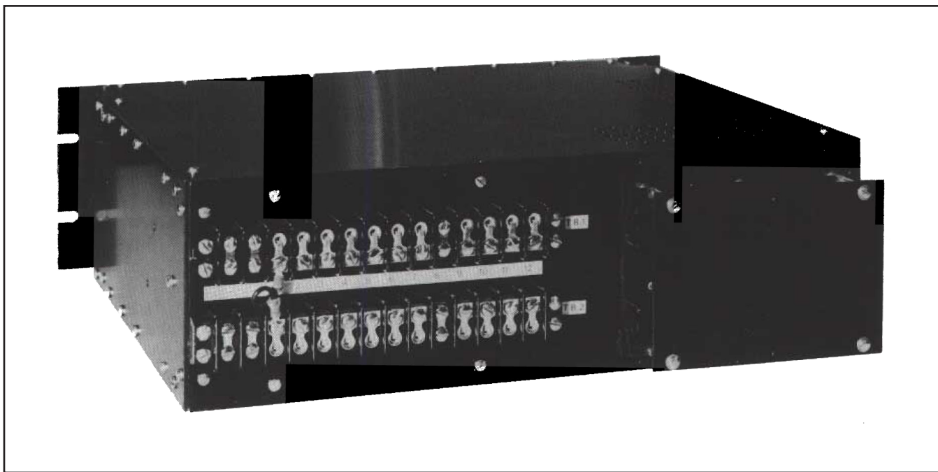
Figura 2. Regletas de terminales para las conexiones de cableado externo.