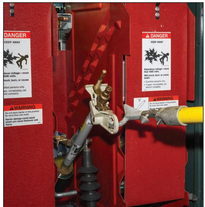
Figura 4. Gancho manipulador Grappler posicionado para extraer el fusible.

▲ Aunque las operaciones que se describen en esta sección se refieren simplemente a los “fusibles”, los procedimientos aplican a los Fusibles de Potencia Tipo SML-20 y SML-4Z.