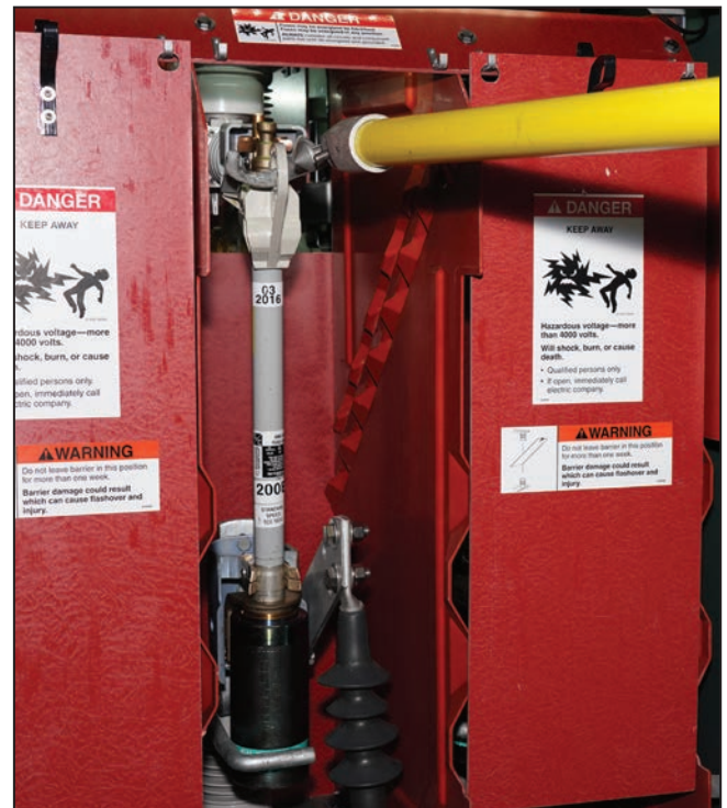
Figura 3. Gancho manipulador Grappler, tal y como se coloca para el golpe de apertura (o de cierre), con la punta más larga insertada en el anillo de tiro.

PASO 3. Retire el gancho manipulador Grappler del anillo de tiro del fusible.