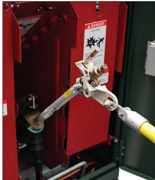
Figura 6. Cierre del fusible.