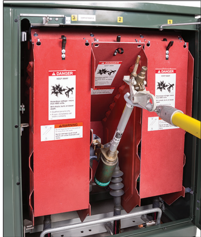
Figura 5. Instalación (o extracción) de un fusible utilizando el gancho manipulador Grappler.

Libere el gancho manipulador Grappler del anillo de tiro. Utilice el gancho manipulador Grappler para empujar el fusible para asegurarse de que quede completamente cerrado.