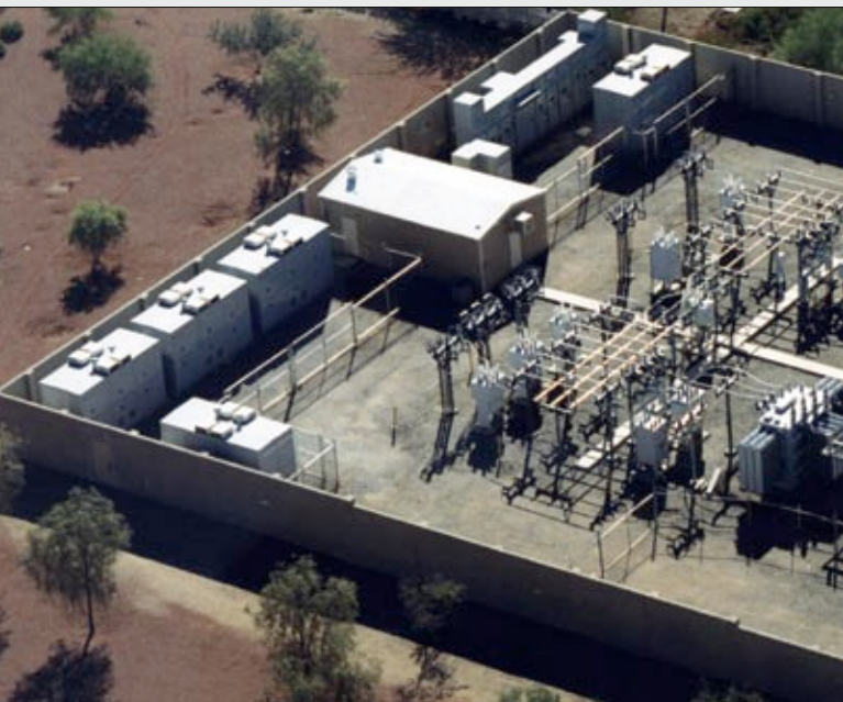
Sistema PureWave UPS de S&C con capacidad de 12,500 kW a 12.47 kV que brinda protección a una enorme carga crítica