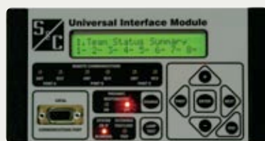
Módulo de Interfase Universal

IntelliTEAM II no es de uso exclusivo para los equipos de seccionamiento aéreos o subterráneos. Es una verdadera solución para la Red de Distribución Inteligente. Al utilizar un Módulo de Interfase Universal, IntelliTEAM II se puede utilizar en conjunto con dispositivos electrónicos inteligentes de casi todas las marcas.