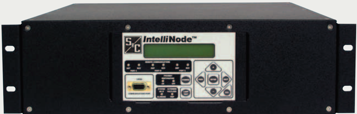
Módulo de interfaz montado en bastidor